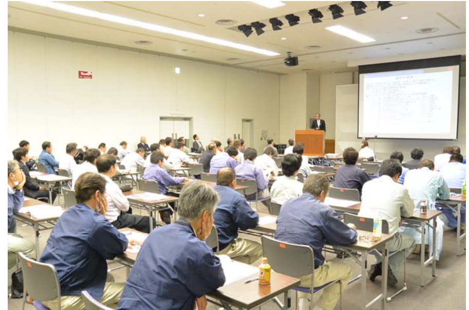
セミナー受講風景

■ 後援／国土交通省 関東地方整備局、公益社団法人 日本技術士会 一般社団法人 栃木県建設業協会、東日本建設業保証株式会社 栃木支店