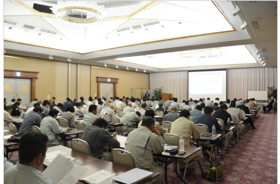
セミナー受講風景

■ 後援／国土交通省 四国地方整備局、一般社団法人 全国建設業協会 一般社団法人 愛媛県建設業協会、西日本建設業保証株式会社