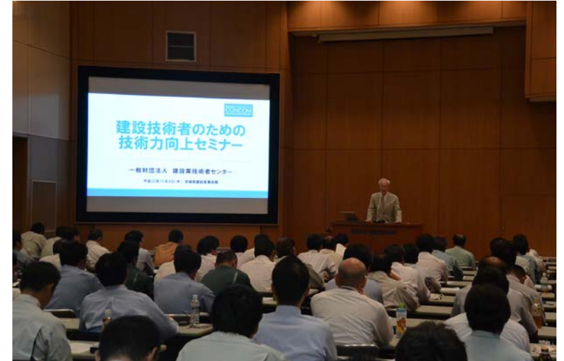
セミナー受講風景