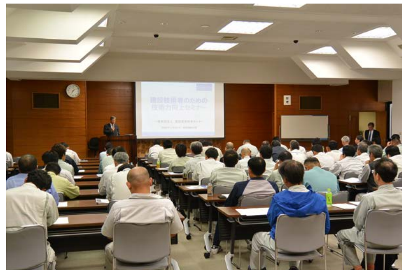
セミナー受講風景