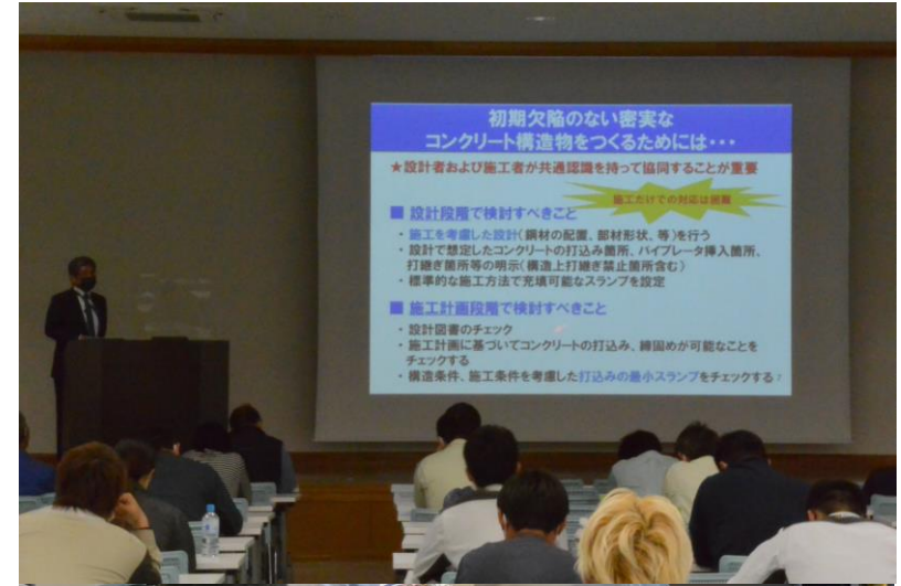
セミナー受講風景