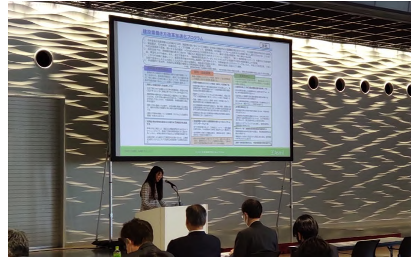
セミナー受講風景