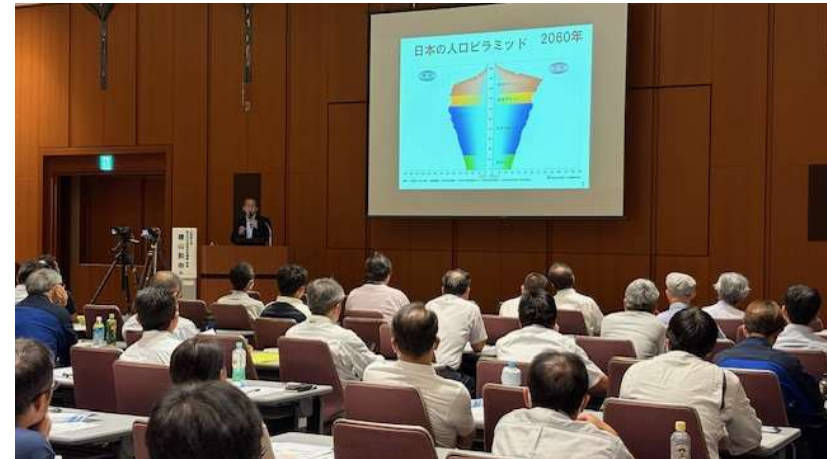
セミナー受講風景

■ 後援／国土交通省 近畿地方整備局、滋賀県、滋賀県建設業協会、京都府建設業協会